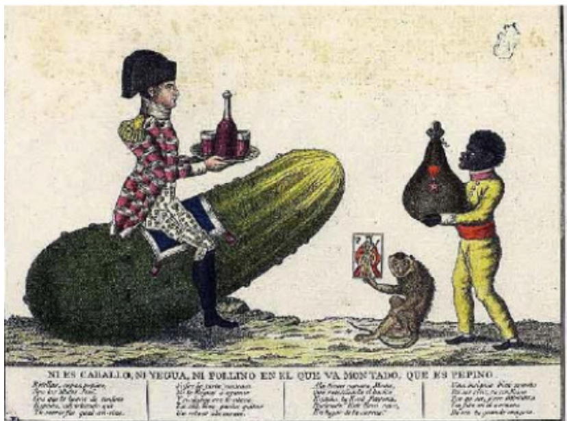
Caricatura de José I Bonaparte.