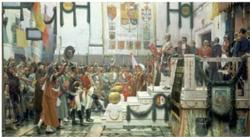
Juramento de la Constitución de 1812