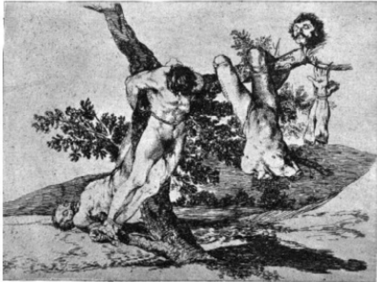
Grande hazaña! Con muertos!